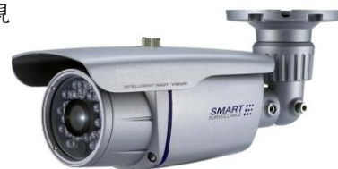
【ハイビジョン防犯カメラ】

コインパーキングやビルなど建物の内外、工場や戸建て住宅まで一般的になりました。 そしてスマホ・タブレット端末の普及はリアルタイムで動画閲覧を可能にし、より鮮明な画像を実現 防犯カメラの映像そのものが警察の捜査にも使われ始め、治安にも役立っています。 『防犯設備士』は防犯のプロ、どの場所にどう設置をすれば効果的なのかを 理論的なデータの裏付けに基づいて設計・施工をいたします。 アフターフォロー・サービスも欠かさず、連絡があった日から翌々日までに現地に出向きます。 私たちは、防犯設備であなたの大切な人・モノを守ります。