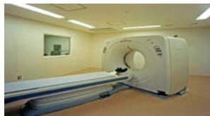
【胸部ヘリカルCT検査】

人として最も幸福なことは愛する家族とともに暮らし、住み慣れた地で 文化的な生活を全うしながら「健やかに長生きすること」と考えています。